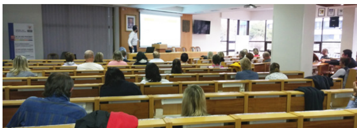
duben 2018 Seminář GDPR a jeho aplikace v praxi