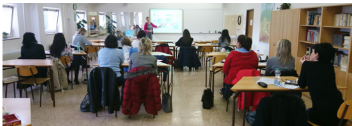
březen 2018 Seminář Celní problematika a Intrastat prakticky a aktuálně